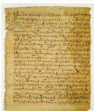
Постанов: «Третий человечество» пригласил Аляксандра парю Аляксандра Михайловичу, 1664 год. Написано по зороте в ссылае. Из фондов Гус- тоскопского музея-заповедника.

использования ресурсов — инновационные, управленческие, информационные — на достижение финансовых целей компании. Однако мир — это битвы между Битой и инновациями. И неуклонность этой битвы придает остроту и смысл своему существованию. В перспективе