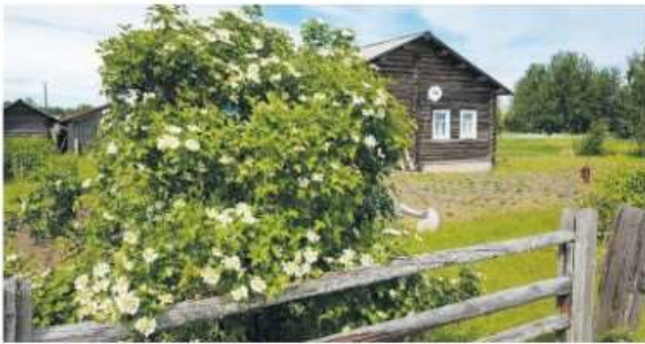
Деревня Марьяна Гора недалеко от реки Пинеги. В ней останавливался Аввакум на пути в ссылку в Сибирь.

телю всего мира! Поспеши и настави, сердце мое, начати с разумом, и кончати дела благими, я же хочу глаголати, аз недостойный: разумею же свое невежество, припадаю молю ти ся, и еже от тебя помощи прося: управи мой ум и утверди сердце мое приготовиться (Продолжение на 14-й стр.)