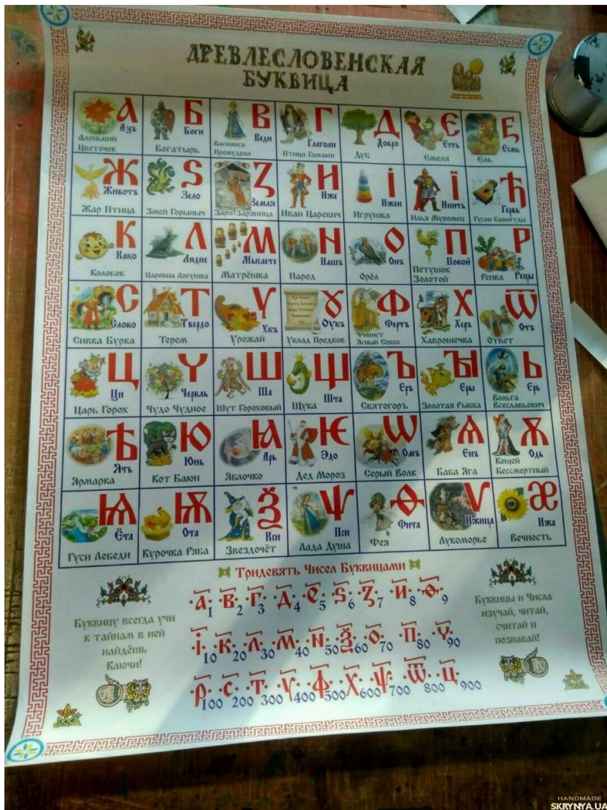
Сказочная Буквица (древлесловенская) https://skrynnya.ua/product/952777