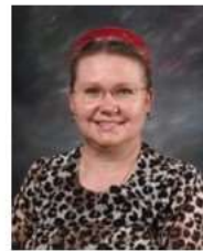
Melania Kieling Kindergarten