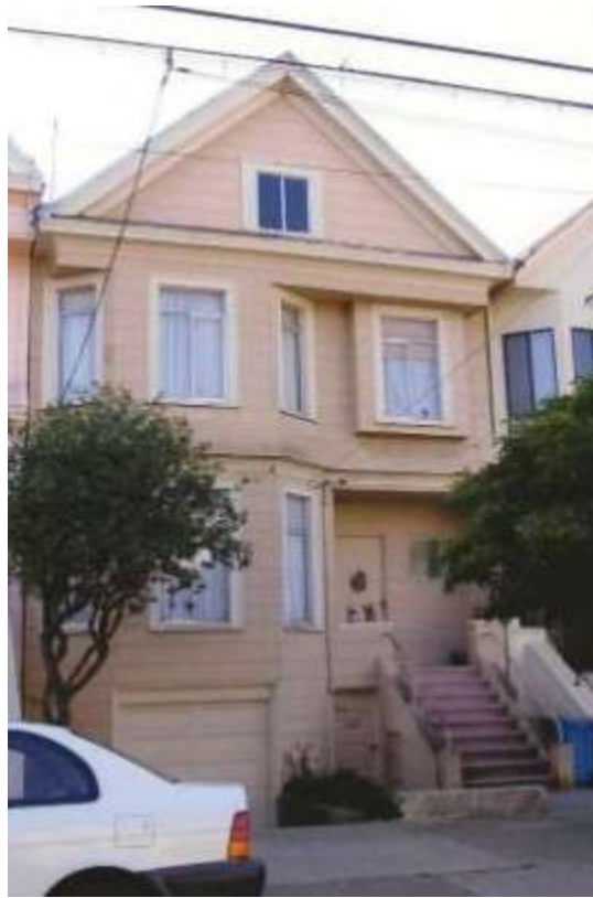
2 nd Avenue Home-Church “House of Prayer”

[This story of the “scism” was told in Chapter 6. A short recap is here.]